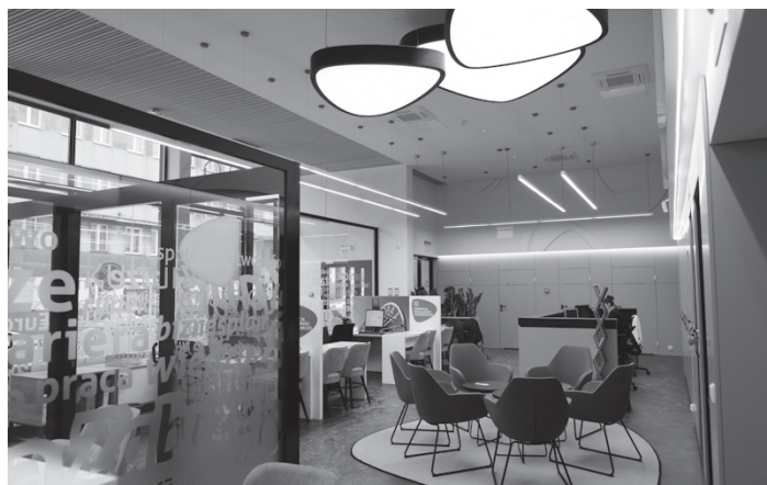
Fot. 1. Siedziba Zabrzeńskiego Centrum Rozwoju Przedsiębiorczości

Wspomniane wyżej instytucje aktywnie współpracują na rzecz przedsiębiorczości, przeprowadzają bezpłatne szkolenia dla przedsiębiorców oraz uczestniczą w wydarzeniach organizowanych przez ZCRP. Pracownik ZCRP w ramach swoich obowiązków udziela również informacji klientom wydziału w zakresie możliwości pozyskiwania środków na rozpoczęcie oraz rozwój działalności gospodarczej. Ponadto w siedzibie centrum (fot. 1) zainteresowane osoby mogą skorzystać z porad prawnych w zakresie prowadzenia działalności gospodarczej, które są świadczone bezpłatnie przez kancelarię prawną.