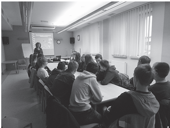
Fot. 2. Warsztaty dla uczniów szkół ponadgimnazjalnych zorganizowane w ramach Światowego Tygodnia Przedsiębiorczości