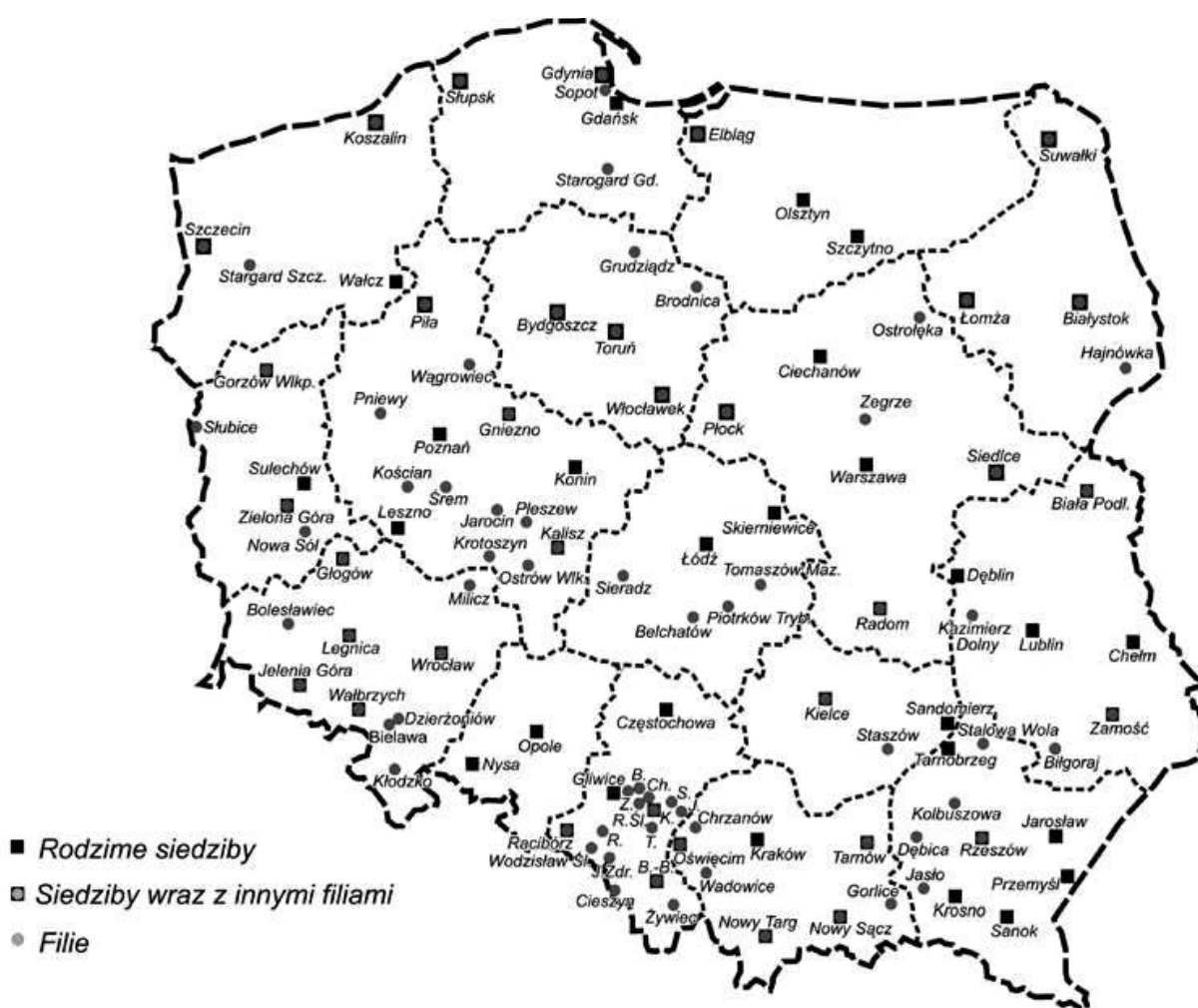
Ryc. 2. Turystyka jako specjalność w uczelniach publicznych i ich filiach (stan na 30.06.2010)

B. – Bytom Br. – Brwinów Ch. – Chorzów D.G. – Dąbrowa Górnicza F. – Falenty