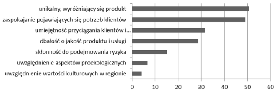
Ryc. 2. Czynniki decydujące o rozwoju firm na obszarach wiejskich* (w %)

* Dane nie sumują się do 100% ze względu na to, że przedsiębiorcy mogli wskazać kilka czynników decydujących o rozwoju.