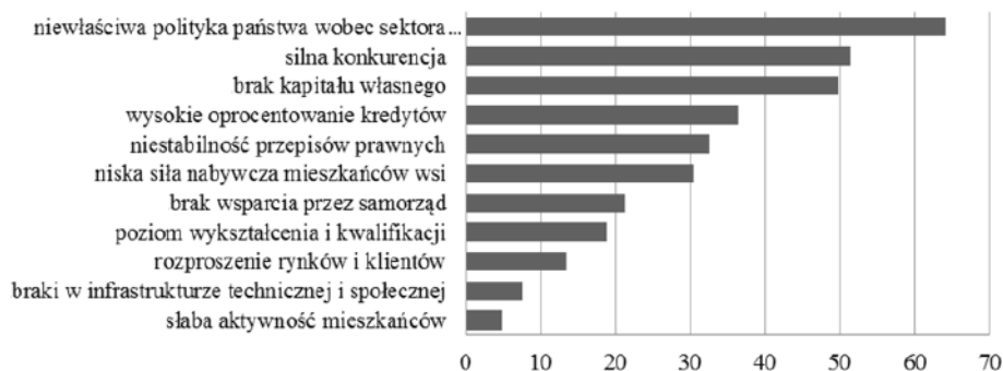
Ryc. 3. Bariery rozwoju firm na obszarach wiejskich (w %)

Źródło: opracowanie własne na podstawie badań ankietowych przeprowadzonych w 2012 r.