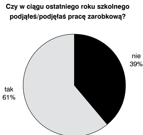
Ryc. 1. Respondenci wg podjętego zatrudnienia w ciągu roku szkolnego (N = 119)

Jednym z przejawów postawy przedsiębiorczej jest podejmowanie pracy. Badani maturzyści pytani o to, czy w ciągu ostatniego roku szkolnego podjęli pracę zarobkową, odpowiedzieli w większości twierdząco (61%) (ryc. 1). Spośród 119 badanych 47 osób nie podjęło pracy, co stanowiło 39% ankietowanych.